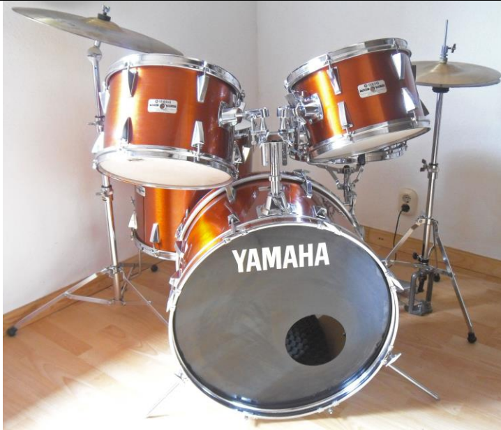
Abb.: Set; Verkauf o. die abgebildeten Becken! Das vorliegende Angebot ist 100% identisch mit dem aus dem YAMAHA Drum-Katalog aus dem Jahr 1981!